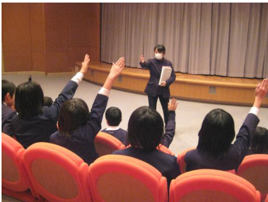
ホールでビデオ絵本も見ました。